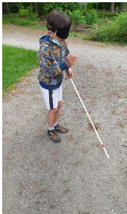
Cesta s handicapem